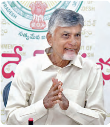
ముఖ్యమంత్రి నారా చంద్రబాబునాయుడు

విజయవాడ, ఏప్రిల్ 29, ప్రభాతవార్త ప్రతినధి: ప్రభుత్వ శాఖలు అందిస్తున్న అన్ని సేవలు ఈ ఏడాది డిసెంబర్ నాటికల్లా ఆన్లైన్లో అందించాలని ముఖ్యమంత్రి నారా చంద్రబాబునాయుడు ఆధికారులను ఆదేశించారు. వాట్సాప్ గవర్నెన్స్ మన మిత్ర పరిధిలోకి అన్ని సేవలు తీసుకు వస్తే ప్రజలకు ప్రభుత్వ కార్యాలయాల చుట్టూ తిరిగే పని ఉండదని చెప్పారు. ఆర్టిఐఎన్పై వివిధ శాఖల ఉన్నతాధికారులతో క్యాంపు కార్యాలయంలో బుధ వారం ముఖ్యమంత్రి సమీక్ష నిర్వహించారు. మన మిత్ర వాట్సాప్ గవర్నెన్స్ ద్వారా ప్రస్తుతం 1,035 సేవలు అందిస్తున్నామని తెలిపారు. వాట్సాప్ గవర్నెన్స్ సేవలు ప్రారంభించిన దగ్గర నుంచి ఇప్పటి వరకు రాష్ట్రంలో 54 లక్షల మంది 1.78 కోట్ల సేవలపొందారని ఈ సందర్భంగా ముఖ్యమంత్రికి అధికారులు వివరించారు. వాట్సాప్ గవర్నెన్స్ సేవల వినియోగంపై ప్రజలకు అవగాహన కల్పించే న్యాయ సీఎంకె తెలిపారు. ఇప్పటి వరకు 24 లక్షల మందికి పైగా వాట్సాప్ గవర్నెన్స్ సేవలు ఎలా పొందాలో అవగాహన కల్పించామని చెప్పారు.