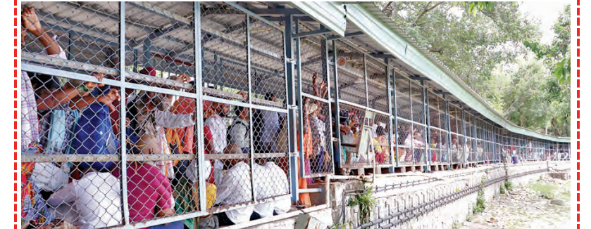
తిరుమలలో దైవదర్శనానికి క్యూలో నిలబడిన భక్తులు