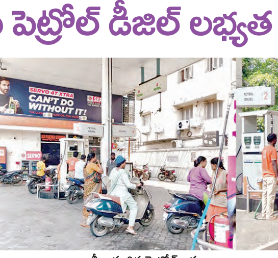
భారీగా మారిన పెట్రోల్ బంకు

యంపు కారణంగా చమురు కొరతపట్టి వీడినట్టోంది. ఇండియా ఇదే పరి స్థితిలో ఉంది. అందుకే, భవిష్యత్తులో చమురు కొరతను ఎదుర్కోవాలిం దుకు భారతీయ వాహనదారులు పెట్రోల్ లో ఇథనాల్ కలపాలని కేం ద్రం భావిస్తోంది. ఇందుకోసం అవసరమైన ఇథనాల్ ను భారత స్థాయిలో ఉత్పత్తి చేయాలని కేంద్రం నిర్ణయించింది. ఇథనాల్ ఉత్పత్తి చేయాలంటే భారత్ సీక్స్ అవసరం. ఒక లీటర్ ఇథనాల్ తయారు చేయ దానికి ఏదీ వేల లీటర్ల సీక్స్ అవసరం. ఎందుకంటే ఇథనాల్ ఉత్పత్తి చేయాలంటే వెరుకు, జొన్న, పరి అవసరం. ఈ వంటలకు ఇథనాల్ సీక్స్ అవసరం. ఇండియాలో ఇథనాల్ ఉత్పత్తి సామర్థ్యం 1,822 కోట్ల లీటర్లు. ఈ స్థాయిలో ఇథనాల్ ఉత్పత్తి కావాలంటే జొన్న, పరి, వెరుకు వంటలు అధిక స్థాయిలో ఉత్పత్తి కావాలి. ఈ వంటలకు ఇథనాల్ సీక్స్ అధికంగా ఉత్పత్తి చేయాలని భావిస్తే దీనికి అనుగుణమైన వంటల సాగును ప్రోత్సహించాలి. దీనివల్ల దేశంలో సాగునీటి కొరత అంశా పెరుగుతుందని నిపుణులు అంటున్నారు.