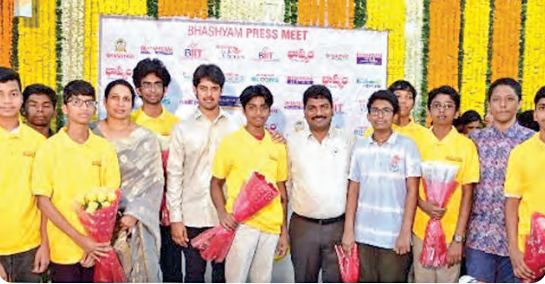
ఆనందోత్సాహంతో భావ్యం విద్యార్థులు

తిరుపతి, చిత్తూరు జిల్లాల్లో అనేక ప్రాంతాల్లో రెండు రోజులుగా తీవ్రంగా కనిపించిన పెట్రోల్, డిజిల్ కొరత ప్రభావం క్రమంగా బుధ వారం ఉదయానికి తగ్గుముఖం పట్టింది. ప్రధానంగా తిరుపతి నగరం లో పెట్రోల్ బంకుల వద్ద పరిస్థితి సాధారణ స్థితి కనిపించింది. గత రెండురోజులుగా బంకుల వద్ద కిలోమీటర్ల వేర కనిపించిన వాహనాల క్యూలు ఇప్పుడు గణనీయంగా తగ్గాయి. ఇప్పటికే అయిదే కంపెనీలు అదనపు ట్యాంకర్ల ద్వారా ఇంధన సరఫరాను పెంచడంతో తిరుపతి చిత్తూరు జిల్లాల్లో పరిస్థితి మెరుగుపడుతోంది. పెట్రోల్ బంకుల వద్ద రద్దీ తగ్గిపోవడంతో వాహనదారులు ఊటల చెందుతున్నారు. రెండు రోజులుగా నాలుగు చక్రాల వాహనాలకు వెయ్యిరూపాయల వరకు మాత్రమే పెట్రోల్ ఇచ్చే పరిస్థితి ఉండగా, కోటి రూపాయల రూపాయలకు పెంచారు. ద్వితీయవారాలకు రూ. 500 వరకు ఇంధ నం అందిస్తున్నారు. సిస్ట్రీ వరకు గంటన్నరకు పైగా క్యూలో నిలబడి పెట్రోల్ కోసం ఎదురుచూడాలిని పరిస్థితి ఉండగా, బుధవారం సాయంత్రానికి 10నిమిషాల్లోనే ఇంధనం అభివృద్ధిని వాహనదారులు చెబుతున్నారు. జిల్లాలో పెట్రోల్ బంకుల వద్ద ఇంధన సరఫరా సాధారణ స్థితికి చేరుకుంటోందని అధికారులు తెలిపారు. బంకుల వద్ద