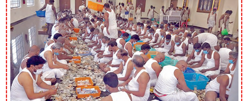
హుందీని లెక్కిస్తున్న దేవదాయ సిబ్బంది

మూడు సంవత్సరాల కిందట తిరుమల పరకామణిలో విడిచి కర్పెన్స్ వోర్ జరిగిన కేసులో జరిగిన పరిణామలన్నిటినీ పూర్తిస్థాయిలో సమగ్ర దర్యాప్తు అంశాలు ఏనుయ్యాయనేది విన్నయం కలిగిస్తోంది. ఈ కేసులో సమగ్ర దర్యాప్తుకు హైకోర్టు దర్యాప్తు అంశాలతో నిండి, ఎసిబి, ఐటి విభాగాలు ఎఫ్ఐఆర్ నమోదు అయినప్పటి నుండి ఆ తరువాత చోటుచేసుకున్న అంశాలపై, లోకాదాలతో రాజీవేసుకోవడం వరకు అన్ని కోణాల్లోనూ పూర్తిస్థాయిలో విచారణ చేపట్టింది. నిందితుడు ఆస్తులపై దర్యాప్తుకు అవినీతినిరోధకశాఖ(ఎన్సిబి)డిజికి ఆదేశాలుచ్చింది. ఈ కేసులో సంబంధం ఉన్న గత టిటిడి చైర్మన్, అధికారులు, పోలీసు అధికారులతోపాటు లోకాదాలతో పరకామణి కేసు రాజీవేసుకున్న న్యాయ మూర్తిపై చర్యలు చేపట్టాలని హైకోర్టు సూచించడంతో గత ఏడాది సంవలనంగా మారాయి. అత్యవసరంగా సి.బి.ఎ.డి.తో విచారణకు ఆదేశించడంతో పరకామణి వోర్ వ్యవహారంలో "వెద్ద" అంశాలు వ్యవహారంలో చేతిపాటుం హుందీ వారికి, అధికారులను చెవటలు పట్టాయి. అయితే ఈ కేసులో ఏమి జరిగిందనేది మాత్రం వెలుగులోకి రాలేదు. 2023లో పరకామణి వోర్ కేసులో తిరుమల వన్ టౌన్ పోలీసులు కేసు నమోదు చేశారు. ఆ తర్వాత లోకాదాలతో రాజీ ప్రోత్సాహించడం వంటివి సంవలనం కలిగిందాయి. అయితే ఈ కేసు దర్యాప్తు మాత్రం ఏనుదనెది టిటిడి వర్గాల్లో సంవలనంగా మారింది.